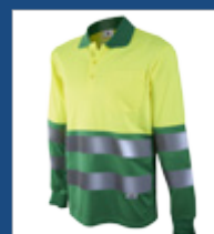
101 Verde medio/ Amarillo AV