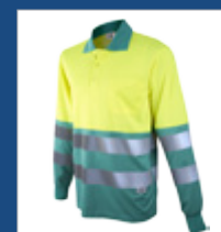
111 Verde claro/ Amarillo AV