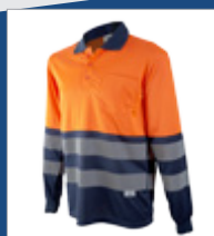
032 Marino/ Naranja AV