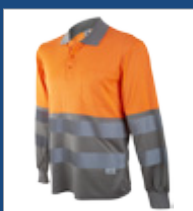
052 Gris/ Naranja AV