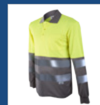
051 Gris/ Amarillo AV