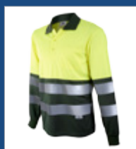
091 Verde oscuro/ Amarillo AV