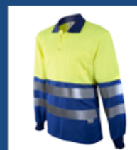
041 Azulina/ Amarillo AV