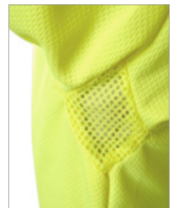
Detalle de las axilas

OEKO-TEX® CONFIDENCE IN TEXTILES STANDARD 100