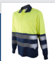
031 Marino/ Amarillo AV